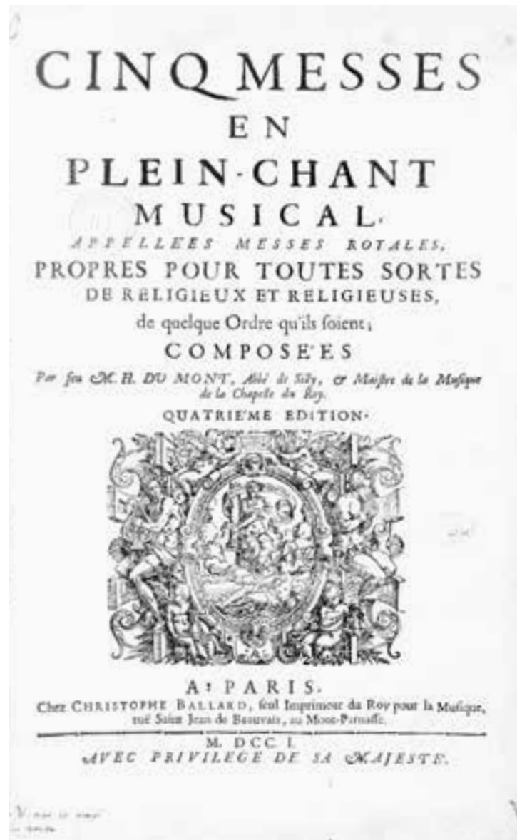
Frontispice de la quatrième édition des Cinq Messes en plein-chant musical, Henry du Mont, 1701.