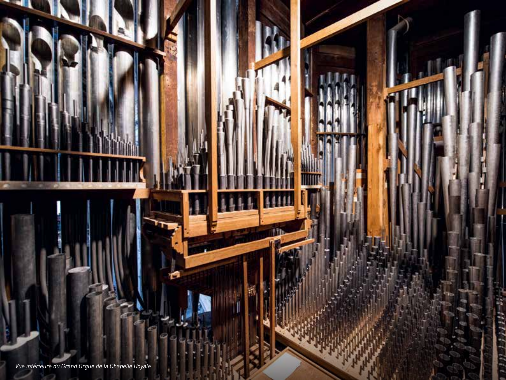
Vue intérieure du Grand Orgue de la Chapelle Royale