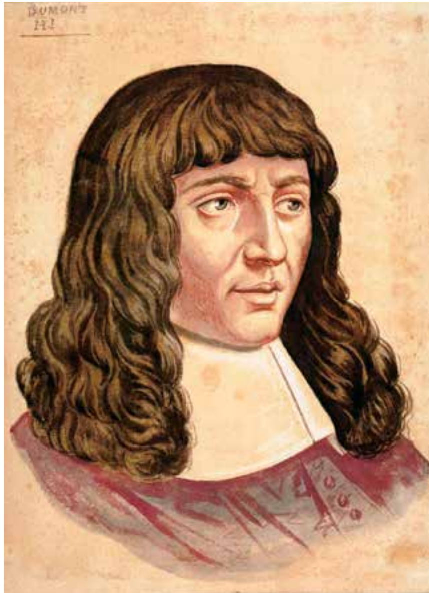
Henri Du Mont, Anonyme, ca. 1741