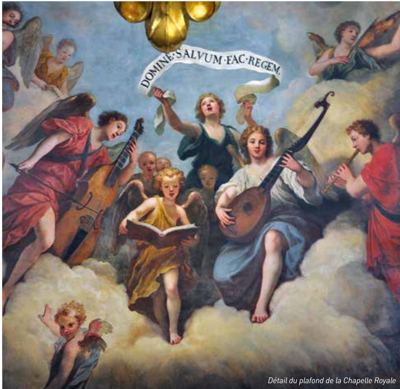
Détail du plafond de la Chapelle Royale