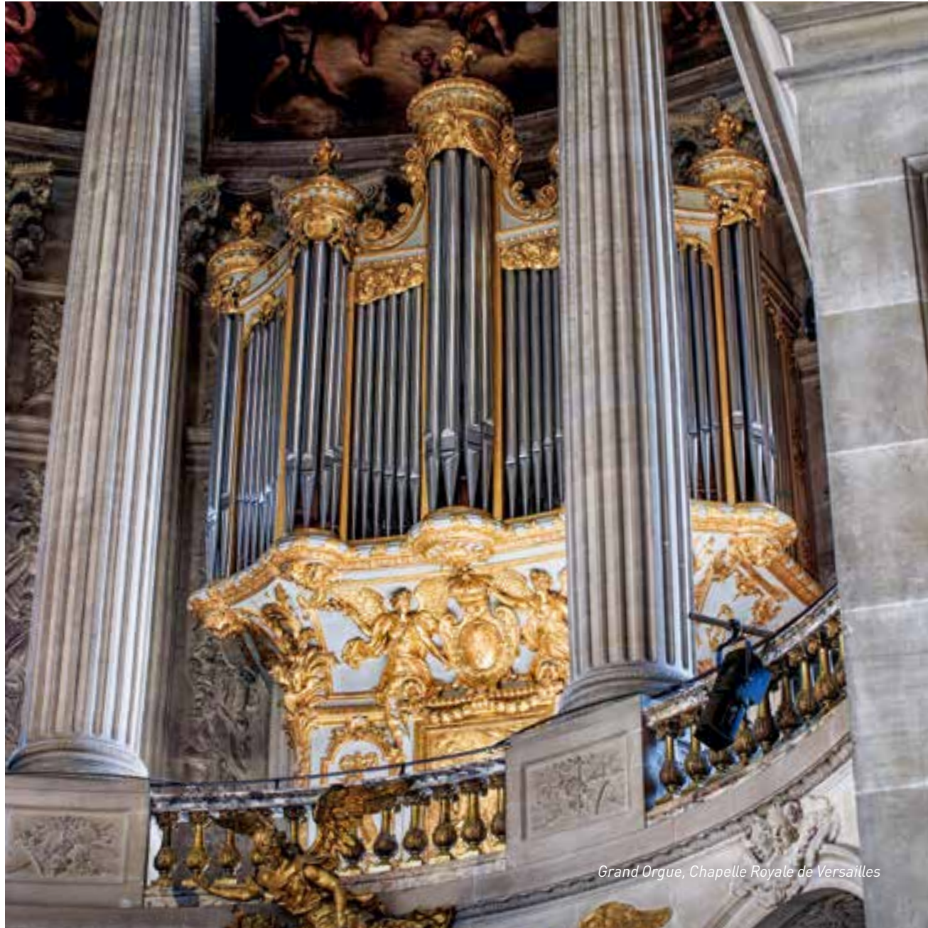
Grand Orgue, Chapelle Royale de Versailles