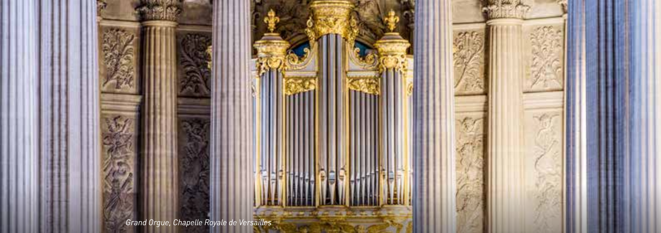
Grand Orgue, Chapelle Royale de Versailles