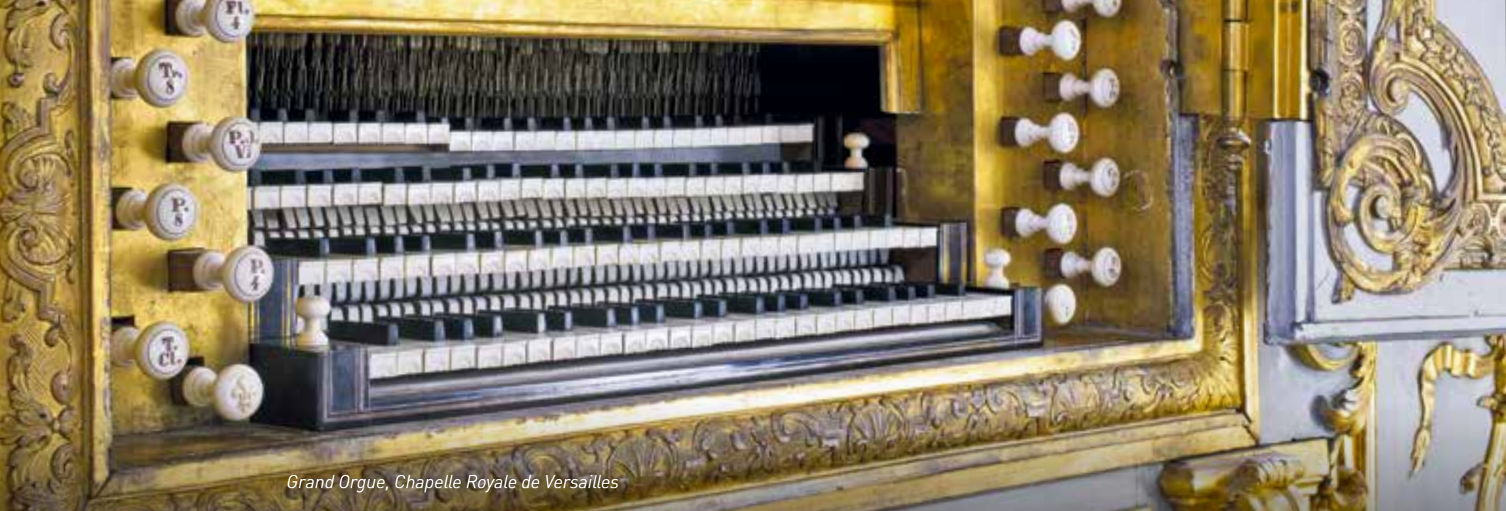
Grand Orgue, Chapelle Royale de Versailles