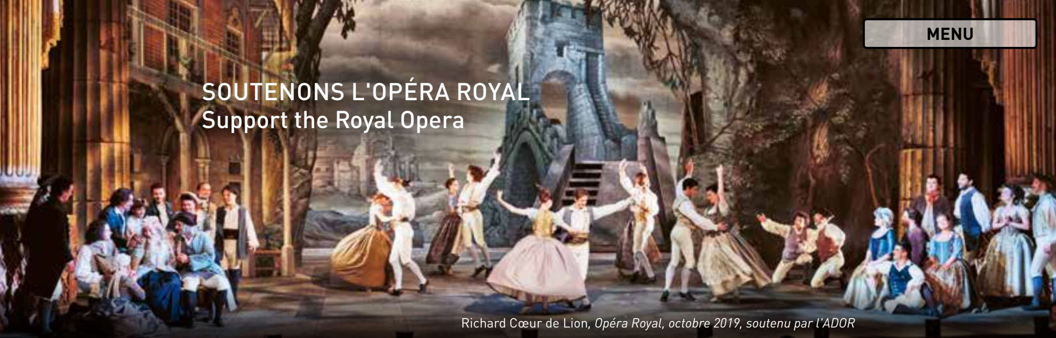
Richard Cœur de Lion, Opéra Royal, octobre 2019, soutenu par l'ADOR

Château de Versailles Spectacles, filiale privée du Château de Versailles, a pour mission de perpétuer le foisonnement musical et artistique qui fait rayonner la résidence royale dans le monde entier. Elle produit la saison musicale de l'Opéra Royal, soit près d'une centaine de représentations par an à l'Opéra Royal et à la Chapelle Royale, des concerts d'exception au Salon d'Hercule et dans la Galerie des Glaces ainsi que les grands spectacles de plein air à l'Orangerie. Elle ne reçoit aucune subvention publique. Ses recettes de billetterie et le soutien de donateurs privés et d'entreprises mécènes lui permettent de construire une saison riche qui réunit plus de 50 000 spectateurs par an.