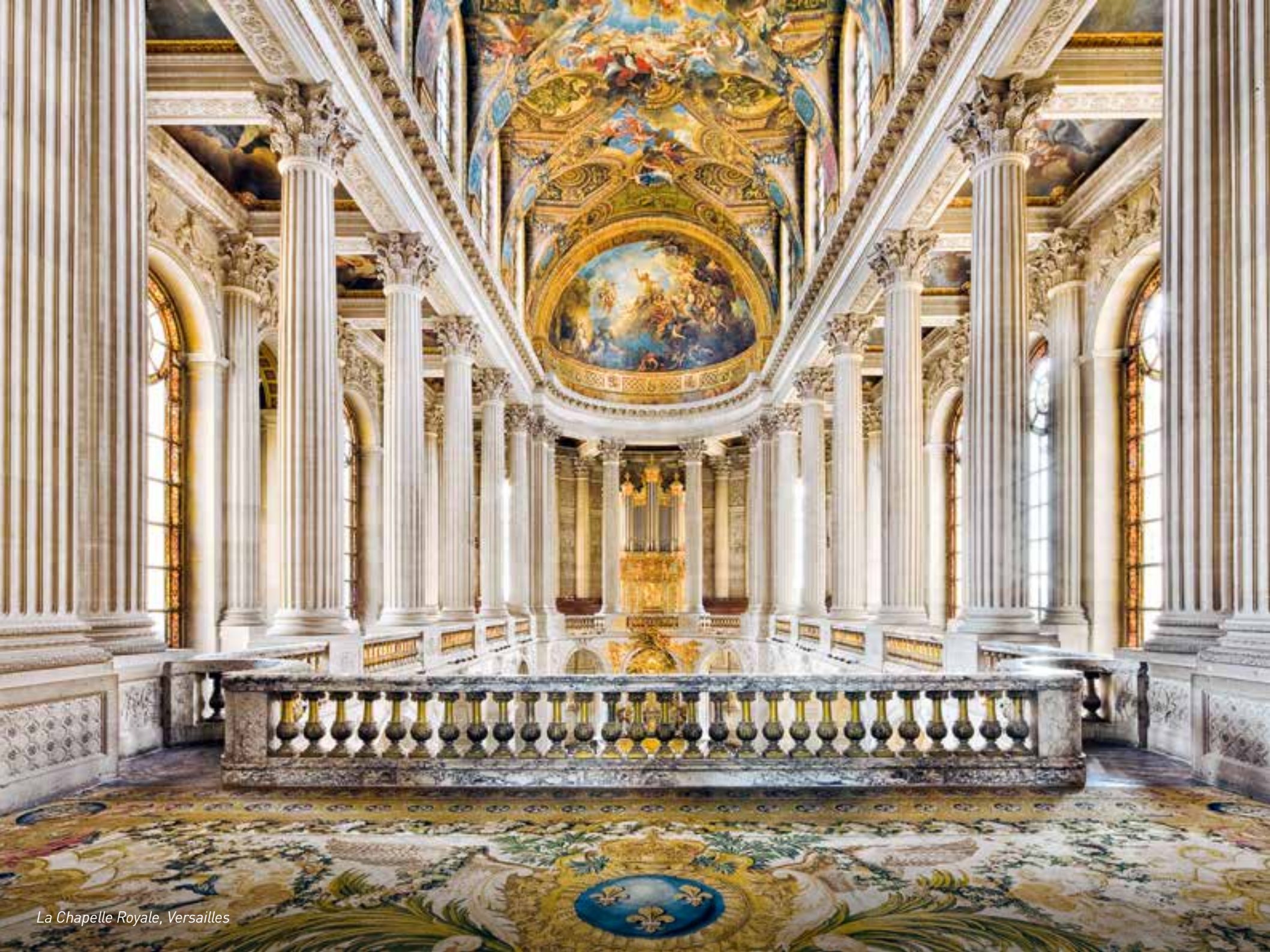
La Chapelle Royale, Versailles