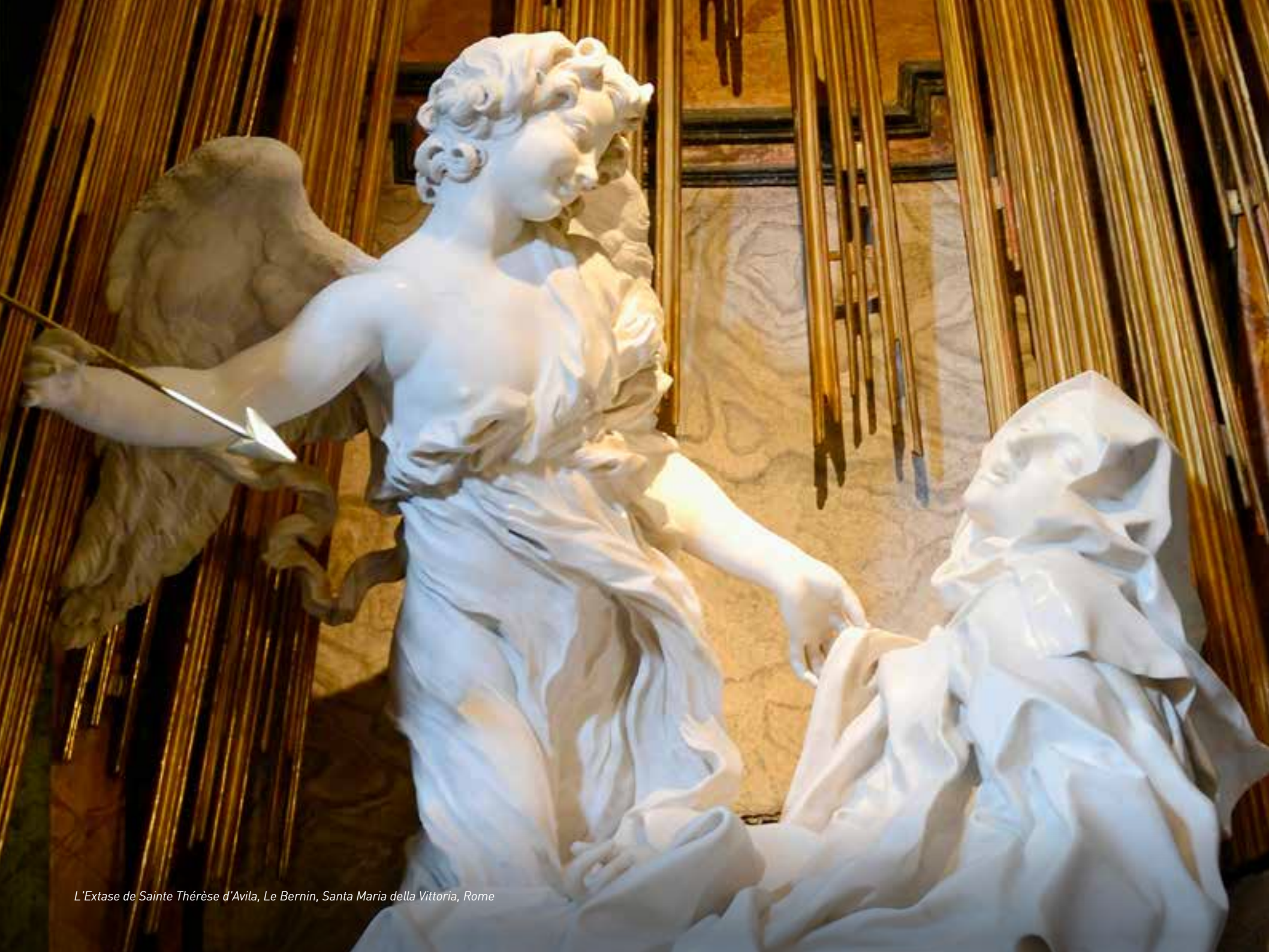
L'Extase de Sainte Thérèse d'Avila, Le Bernin, Santa Maria della Vittoria, Rome