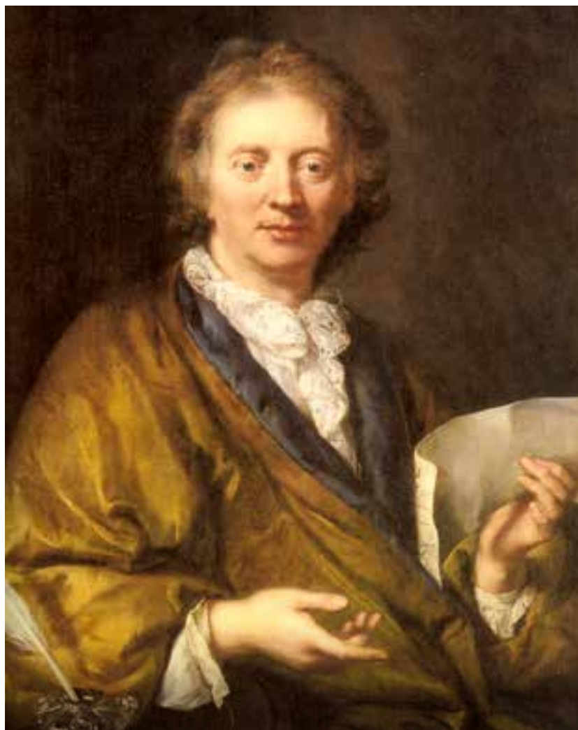
François Couperin, Anonyme, XVIII e siècle