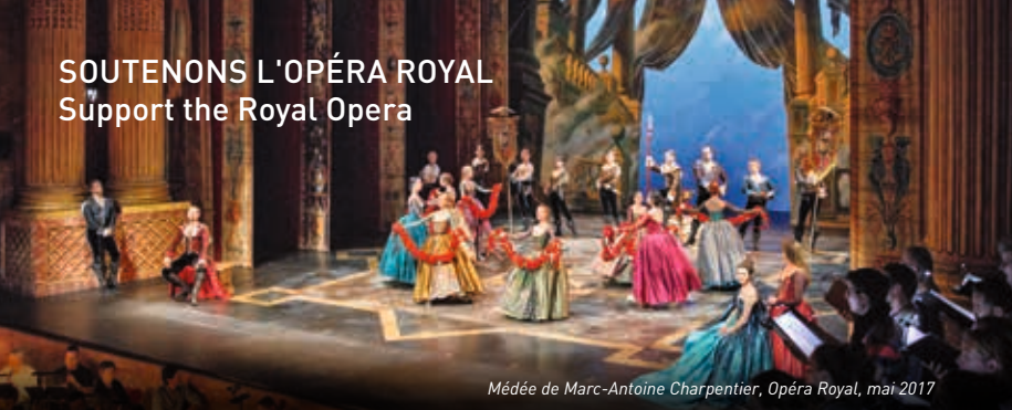
Médée de Marc-Antoine Charpentier, Opéra Royal, mai 2017

Château de Versailles Spectacles, filiale privée du Château de Versailles, a pour mission de perpétuer le foisonnement musical et artistique qui fait rayonner la résidence royale dans le monde entier. Elle produit la saison musicale de l'Opéra Royal, soit près d'une centaine de représentations par an à l'Opéra Royal et à la Chapelle Royale, des concerts d'exception au Salon d'Hercule et dans la Galerie des Glaces ainsi que les grands spectacles de plein air à l'Orangerie. Elle ne reçoit aucune subvention publique. Ses recettes de billetterie et le soutien de donateurs privés et d'entreprises mécènes lui permettent de construire une saison riche qui réunit plus de 50 000 spectateurs par an.