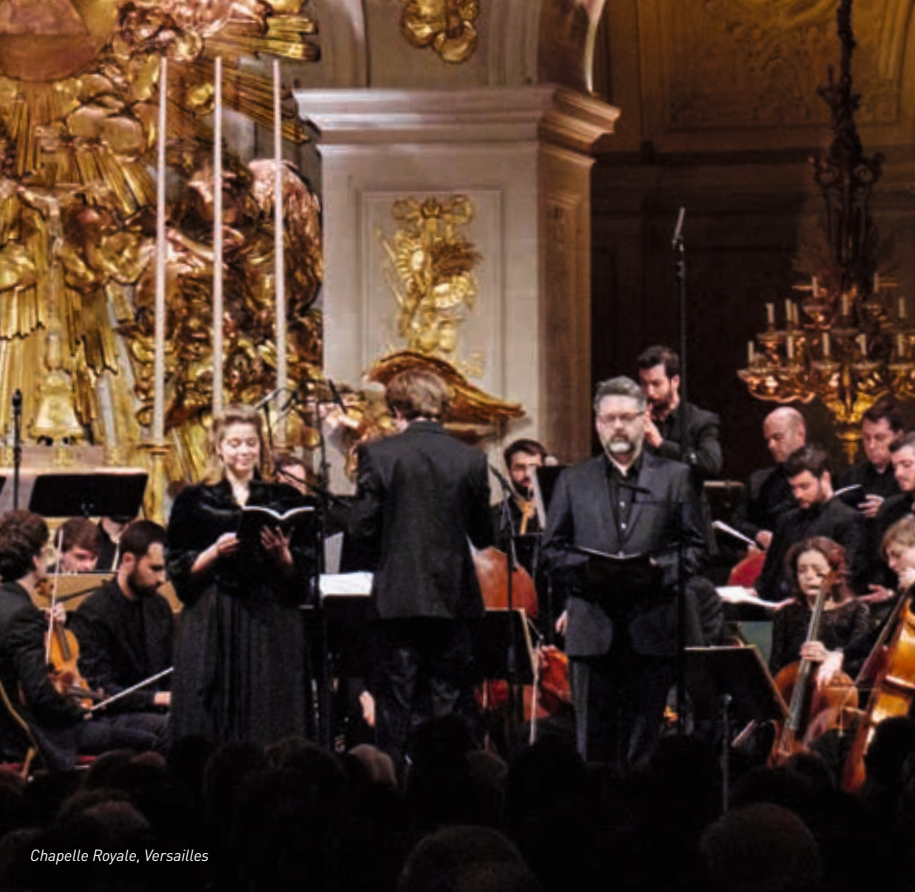
Chapelle Royale, Versailles