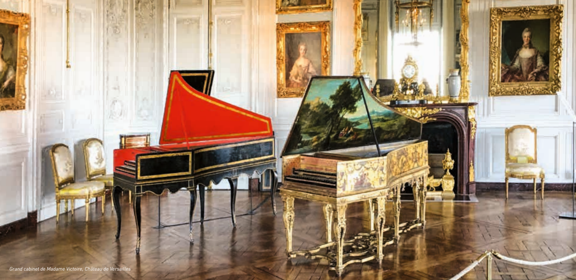
Grand cabinet de Madame Victoire, Chateau de Versailles