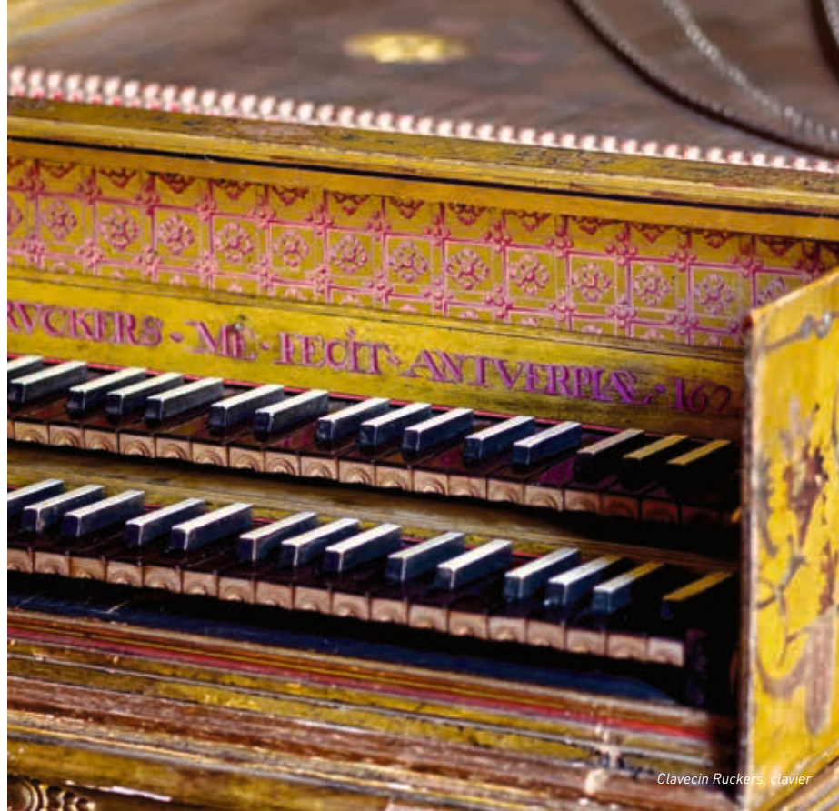
Clavecin Ruckers, clavier