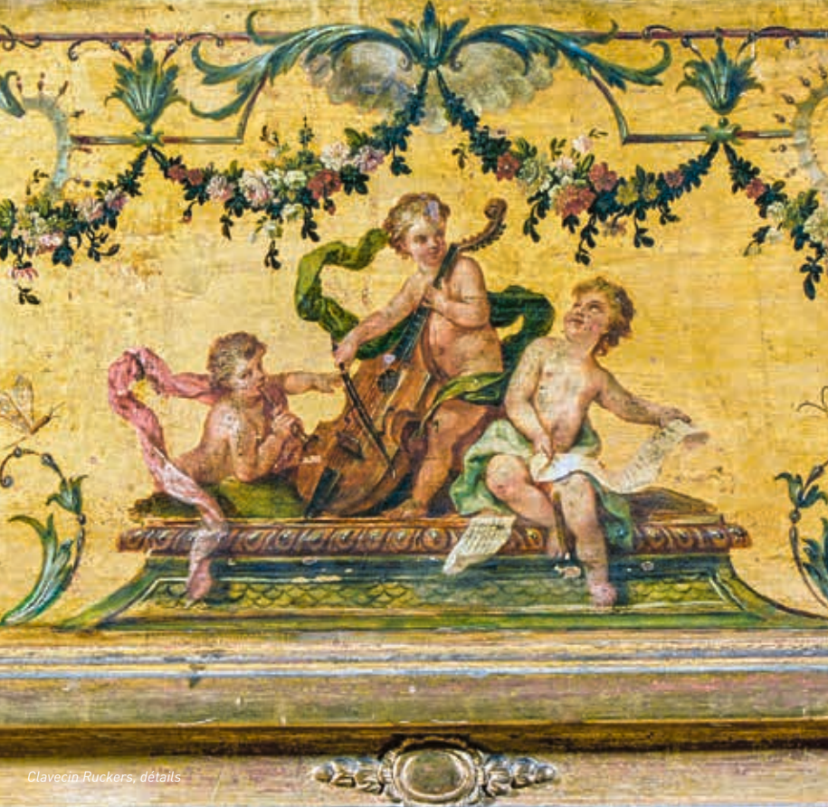
Clavecin Ruckers, détails