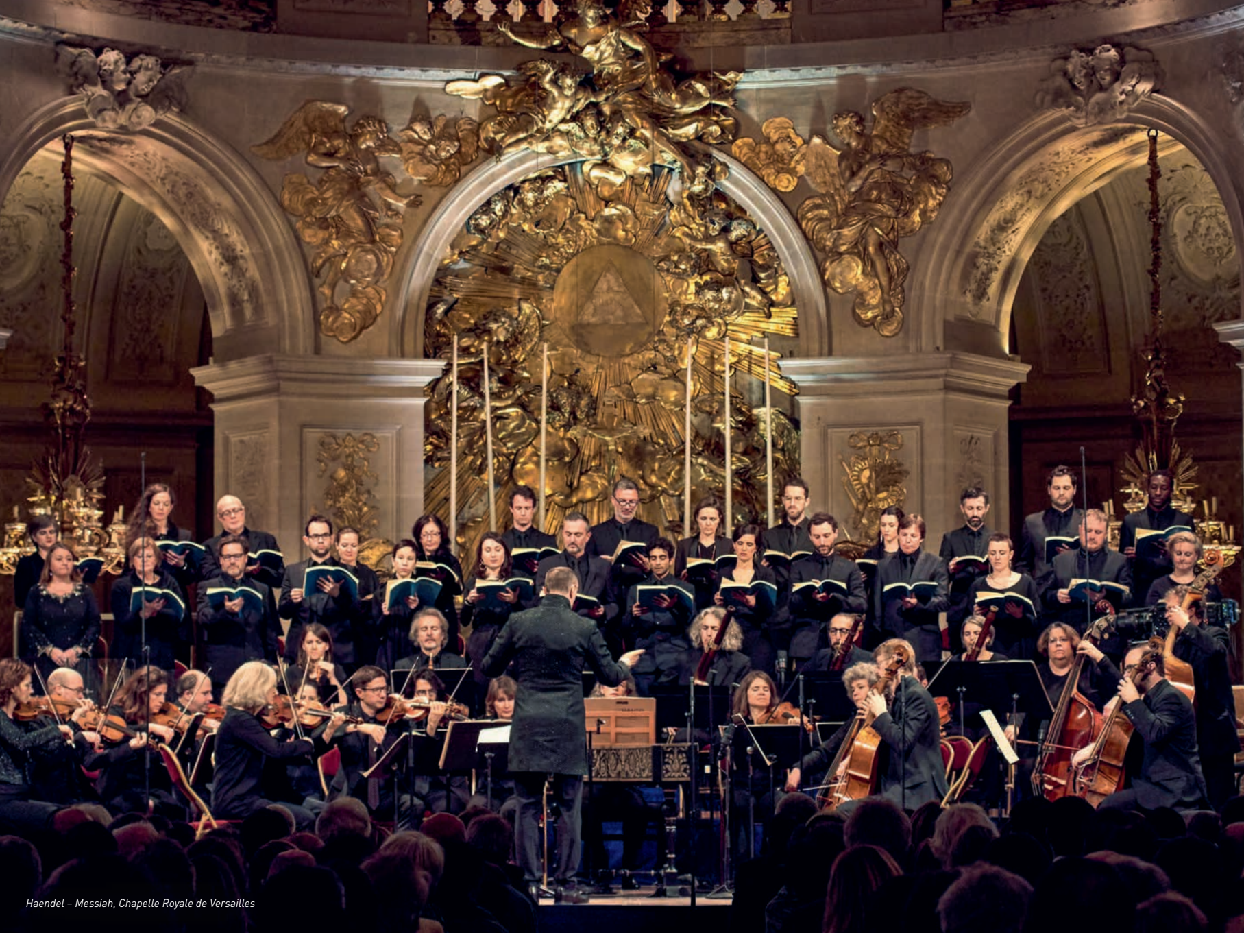
Haendel - Messiah, Chapelle Royale de Versailles