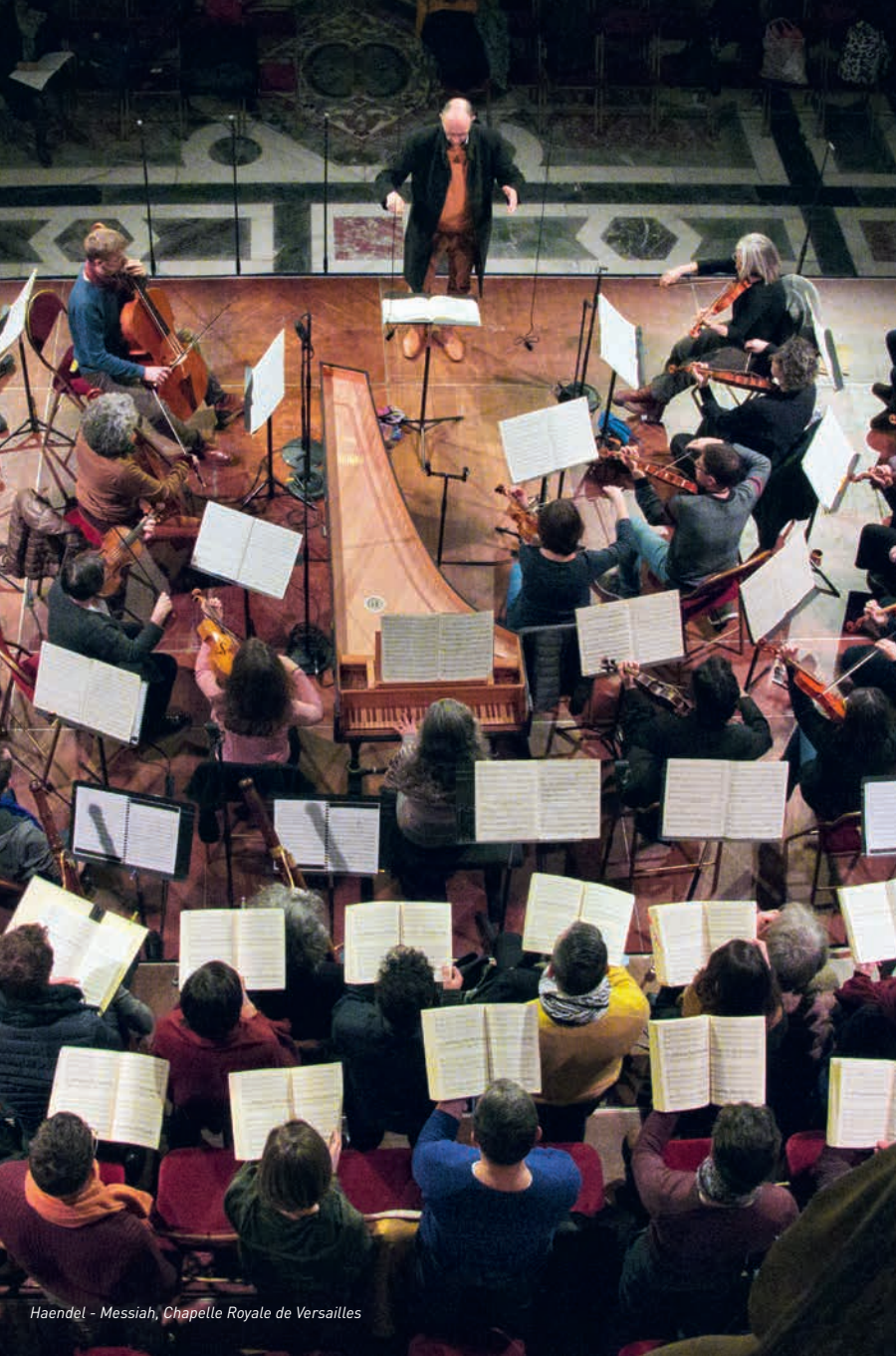
Haendel - Messiah, Chapelle Royale de Versailles