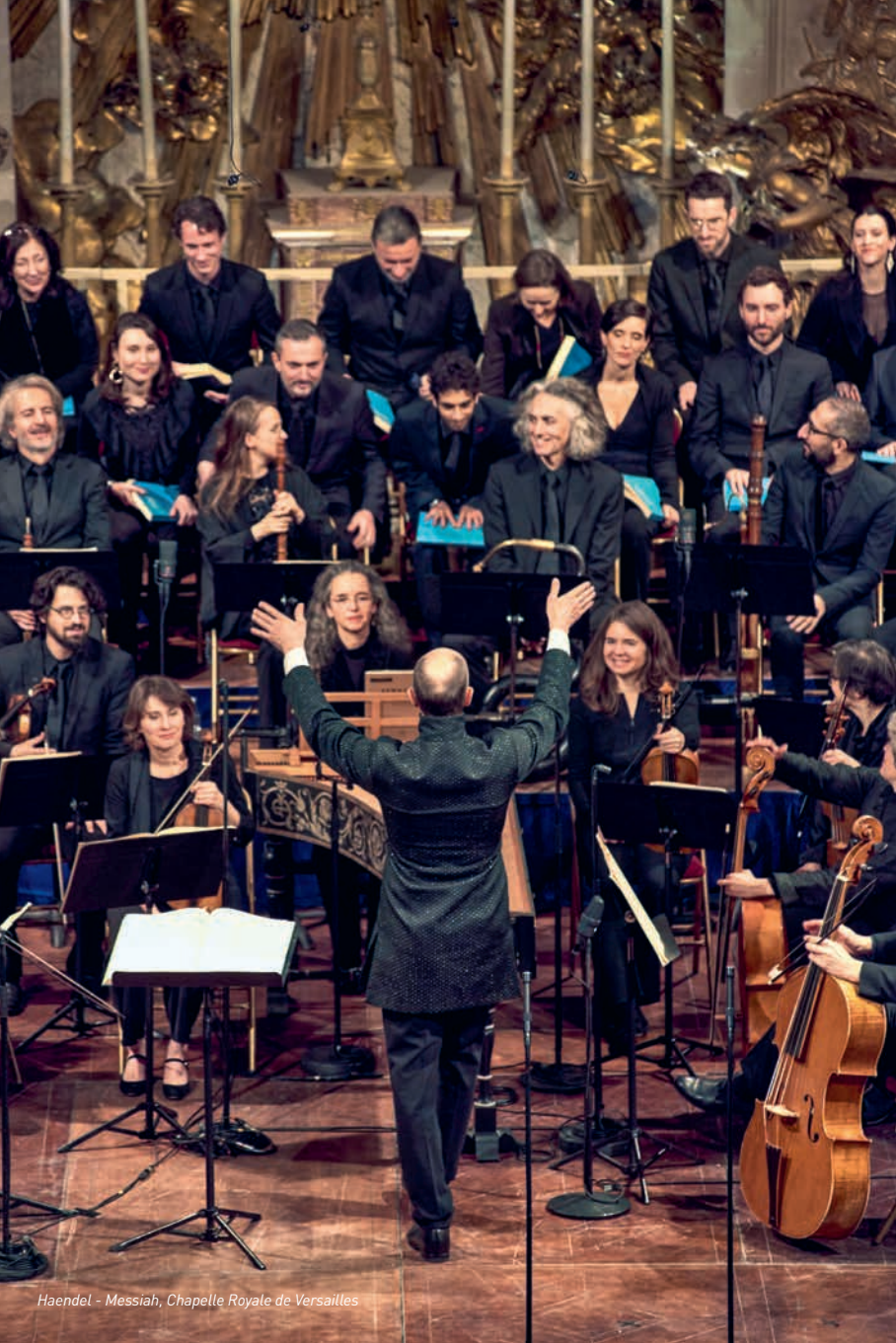
Haendel - Messiah, Chapelle Royale de Versailles