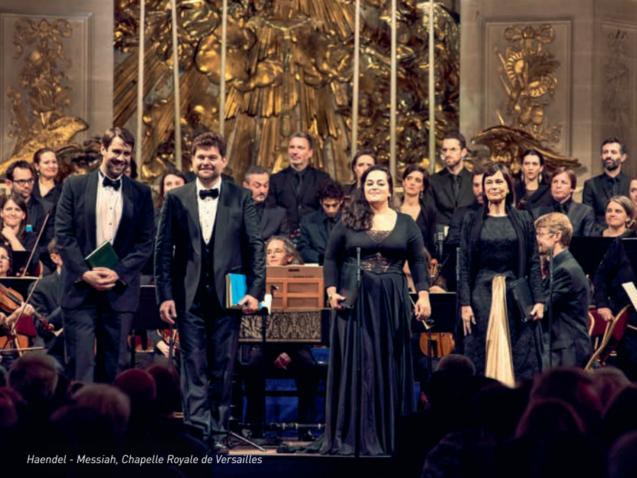
Haendel - Messiah, Chapelle Royale de Versailles