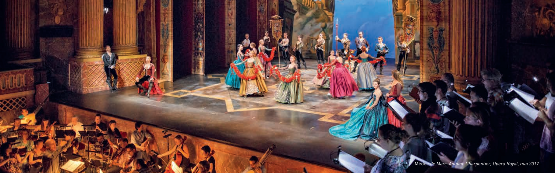
Médée de Marc-Antoine Charpentier, Opéra Royal, mai 2017