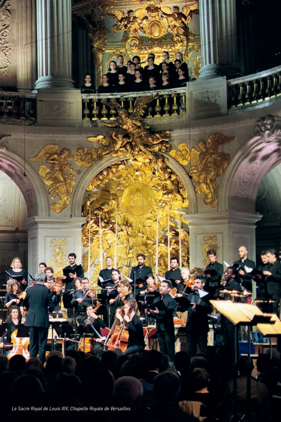
Le Sacre Royal de Louis XIV, Chapelle Royale de Versailles