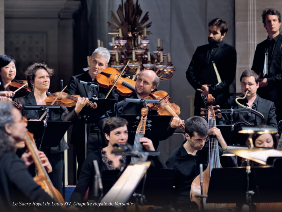
Le Sacre Royal de Louis XIV, Chapelle Royale de Versailles