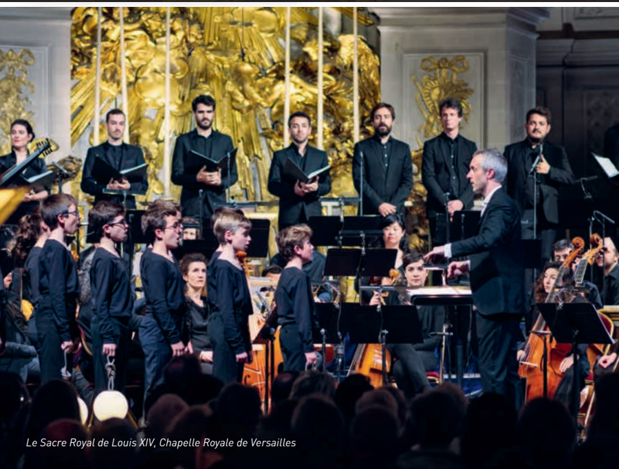
Le Sacre Royal de Louis XIV, Chapelle Royale de Versailles