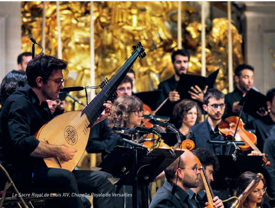
Le Sacre Royal de Louis XIV, Chapelle Royale de Versailles

Fondé à Lyon en 2009, Correspondances réunit sous la direction du claveciniste et organiste Sébastien Daucé une troupe de chanteurs et d'instrumentistes, tous spécialistes de la musique du Grand Siècle. En quelques années d'existence, Correspondances est devenu une référence dans le répertoire de la musique française du XVII e siècle. Sous les auspices des correspondances baudelairiennes, l'ensemble donne aussi bien à entendre une musique aux sonorités qui touchent directement l'auditeur d'aujourd'hui qu'à voir des formes plus originales et rares telles que l'oratorio ou le ballet de cour portés à la scène.