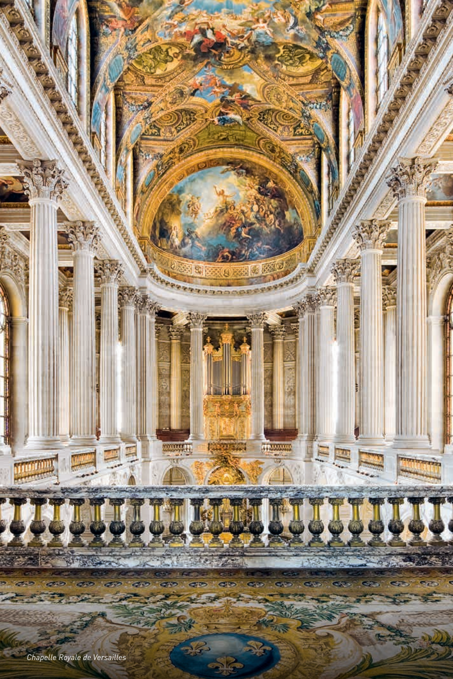
Chapelle Royale de Versailles