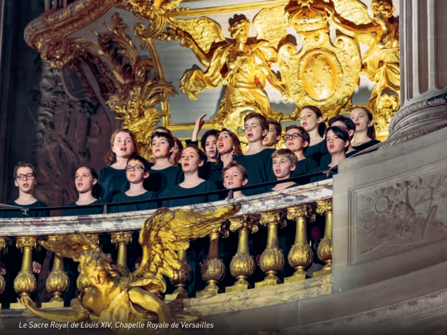
Le Sacre Royal de Louis XIV, Chapelle Royale de Versailles