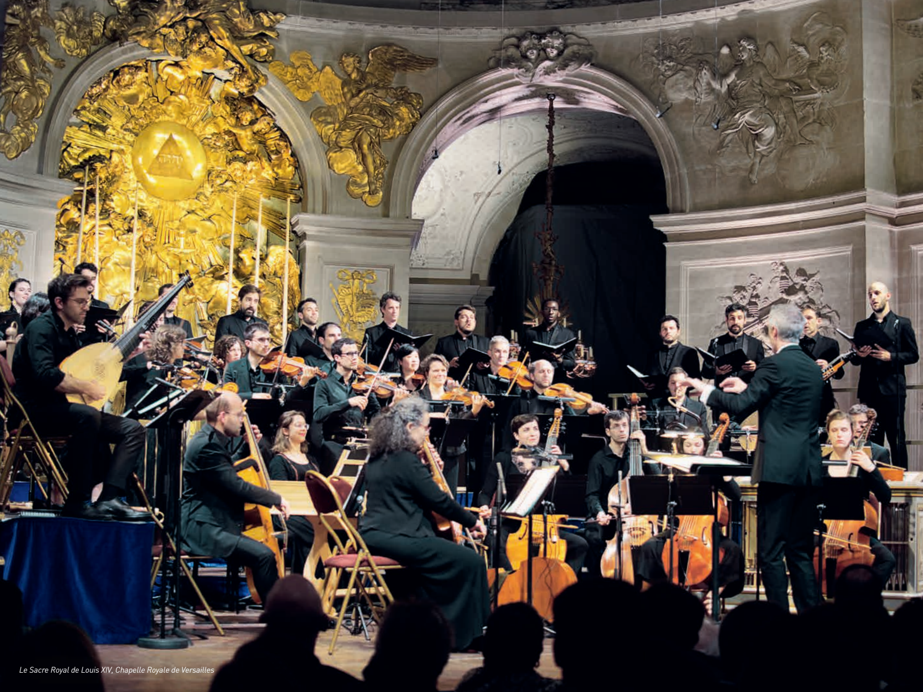
Le Sacre Royal de Louis XIV, Chapelle Royale de Versailles