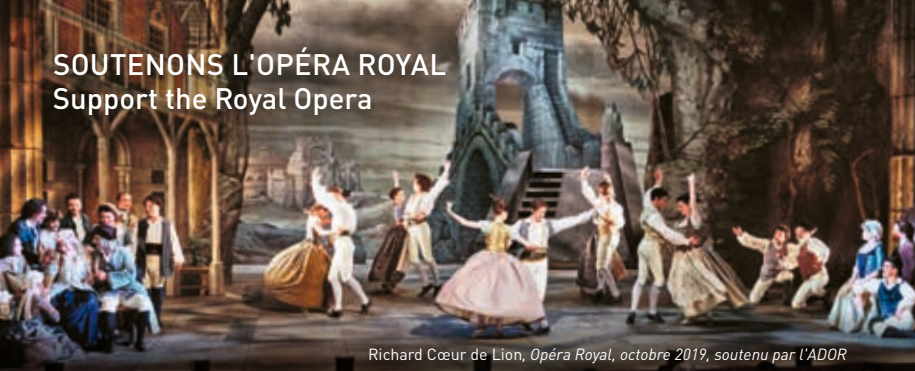
Richard Cœur de Lion, Opéra Royal, octobre 2019, soutenu par l'ADOR

Château de Versailles Spectacles, filiale privée du Château de Versailles, a pour mission de perpétuer le foisonnement musical et artistique qui fait rayonner la résidence royale dans le monde entier. Elle produit la saison musicale de l'Opéra Royal, soit près d'une centaine de représentations par an à l'Opéra Royal et à la Chapelle Royale, des concerts d'exception au Salon d'Hercule et dans la Galerie des Glaces ainsi que les grands spectacles de plein air à l'Orangerie. Elle ne reçoit aucune subvention publique. Ses recettes de billetterie et le soutien de donateurs privés et d'entreprises mécènes lui permettent de construire une saison riche qui réunit plus de 50 000 spectateurs par an.