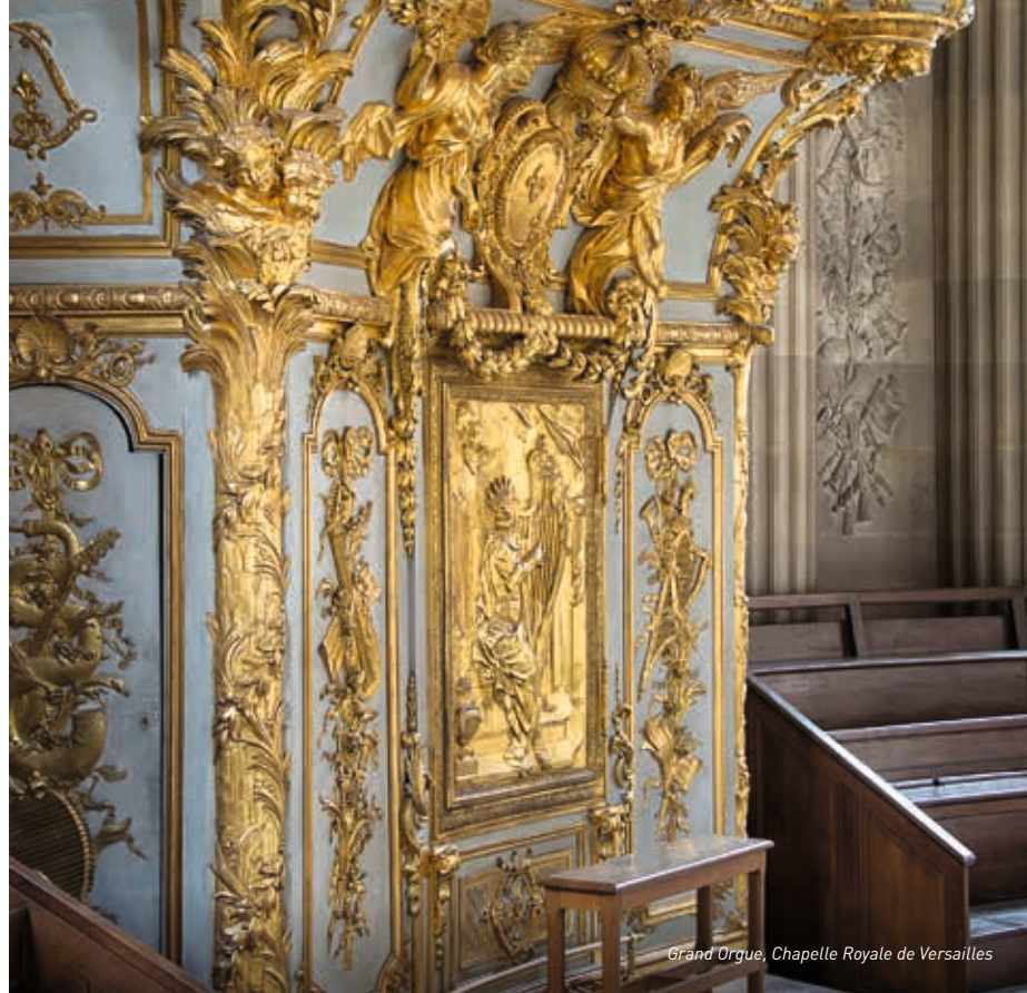
Grand Orgue, Chapelle Royale de Versailles

L'orgue actuel a été inauguré les 18 et 19 novembre 1995 par Michel Chapuis.