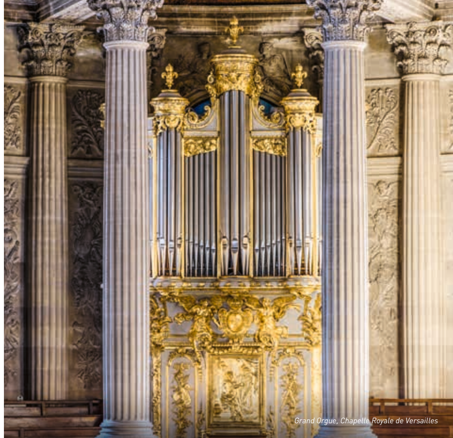
Grand Orgue, Chapelle Royale de Versailles

Après la mort de Louis XIV, en 1715, l'instrument subit des transformations. Relevé à plusieurs reprises par les descendants de Robert Clicquot, sa composition est remaniée en 1736 par