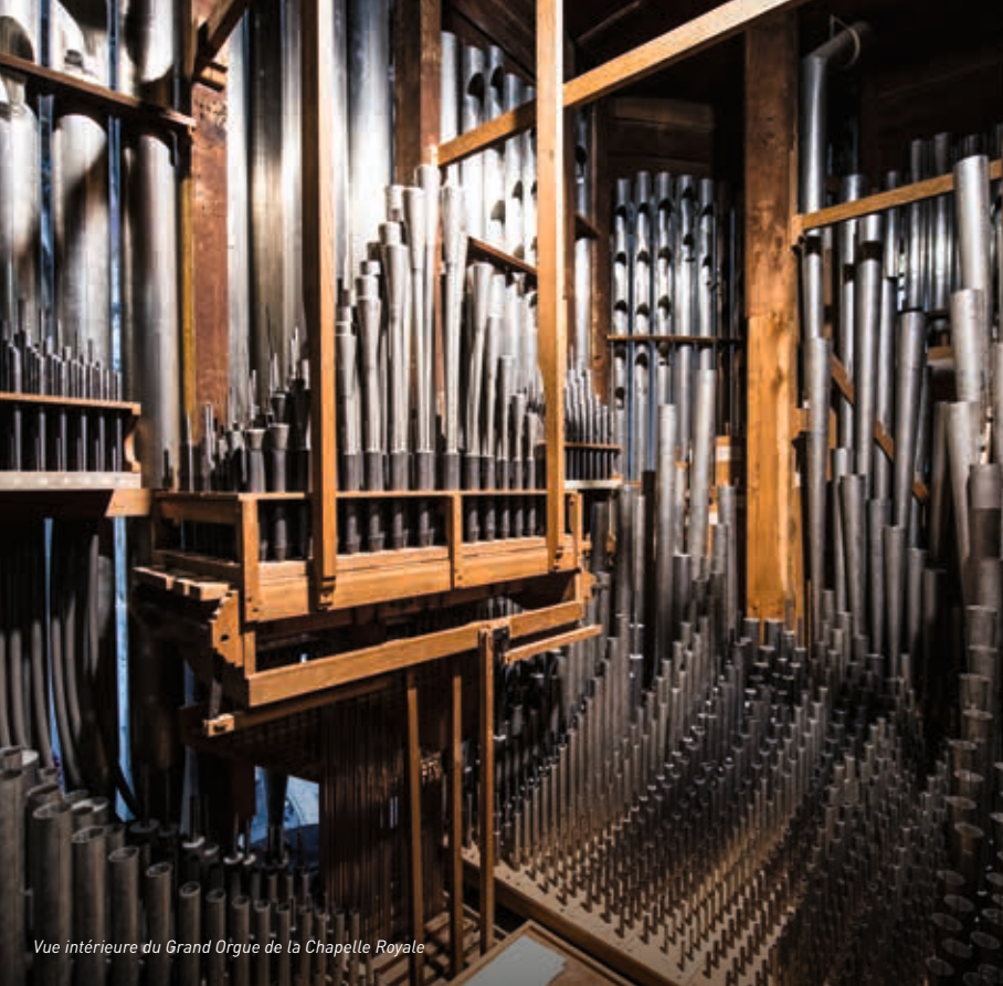
Vue intérieure du Grand Orgue de la Chapelle Royale