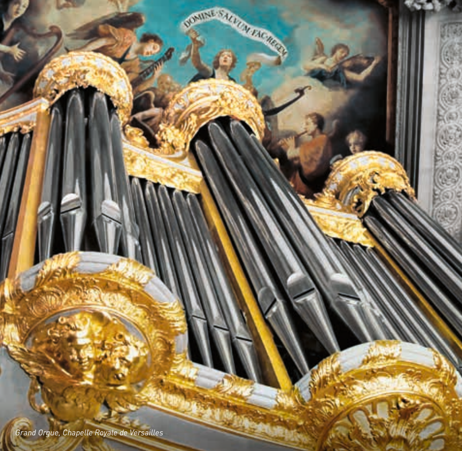
Grand Orgue, Chapelle Royale de Versailles