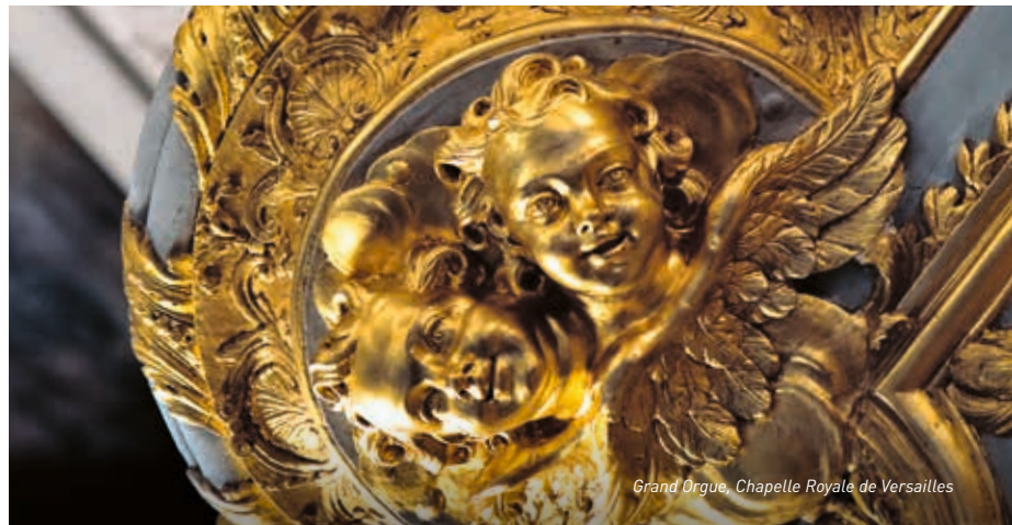
Grand Orgue, Chapelle Royale de Versailles

ausgezeichnet. Im Dezember 2019 veröffentlicht er Noëls Baroques à Versailles (Barocke Weihnachtsfeste in Versailles) , aufgenommen in der Hauptorgel der Königlichen Kapelle von Versailles, in Zusammenarbeit mit dem Chor Les Pages du Centre de musique baroque de Versailles, zu diesem Zeitpunkt noch unter dem Label Château de Versailles Spectacles (CD erhielt die Auszeichnung, 5 Diapasons'). In diesem Jahr wird er sechs Aufnahmen herausbringen, die Charpentier, Händel und Rameau gewidmet sind.