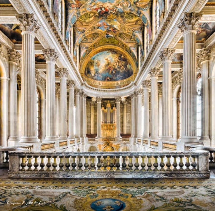
Chapelle Royale de Versailles